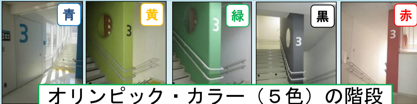
オリンピック・カラー（5色）の階段