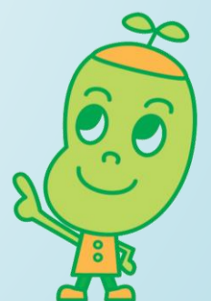
マスコットキャラクター「じょうとうくん」

信頼と敬意に基づき、互いに認め合い、学び合う 中で主体的に自らの能力を伸ばす学校